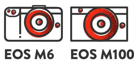
EOS M6 EOS M100