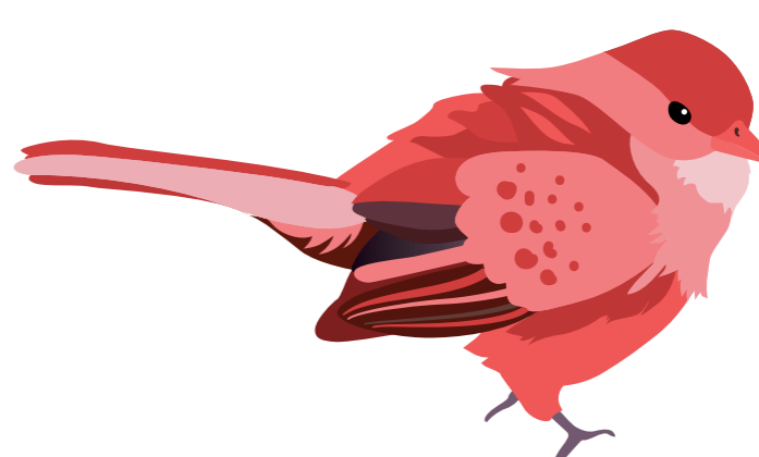
นกจับแมลง