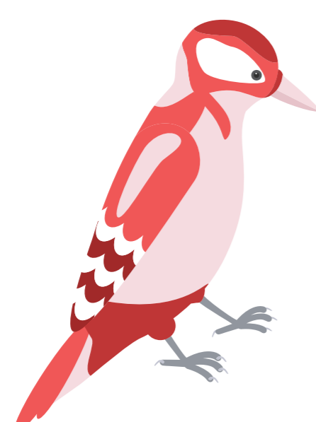
นกหัวขวานเหลือง