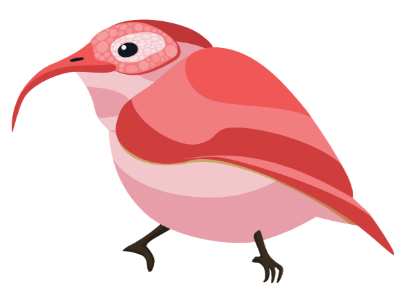
นกกี นปลี อกเหลือง