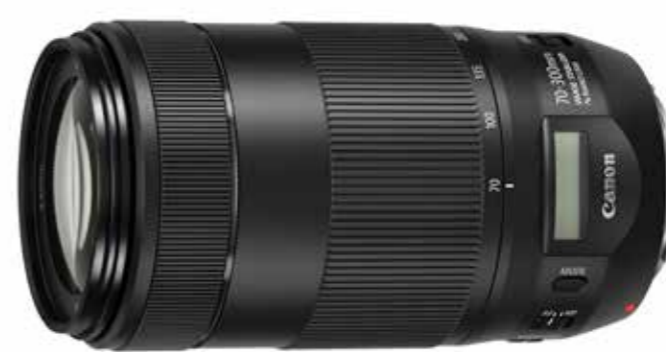
EF70-300mm f/4-5.6 IS II USM