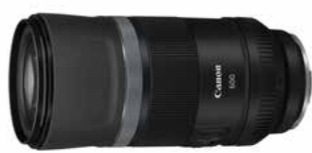
RF600mm f/11 IS STM