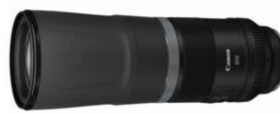
RF800mm f/11 IS STM