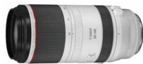
RF100-500mm f/4.5-7.1L IS USM